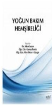
Yoğun Bakım Hemşireliği