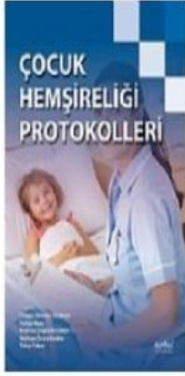
Çocuk Hemşireliği Protokolleri