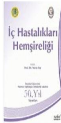
İç Hastalıkları Hemşireliği