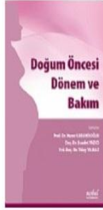
Doğum Öncesi Dönem Ve Bakım