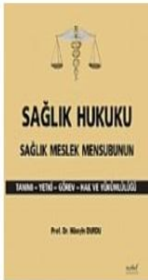
Sağlık Hukuku Sağlık Meslek Mensubunun...