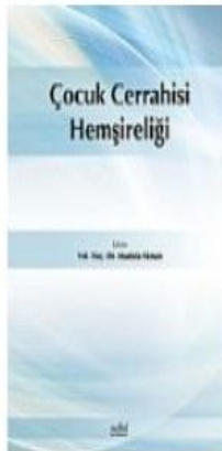
Çocuk Cerrahisi Hemşireliği