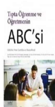
Tıpta Öğrenme Ve Öğretmenin ABC'si