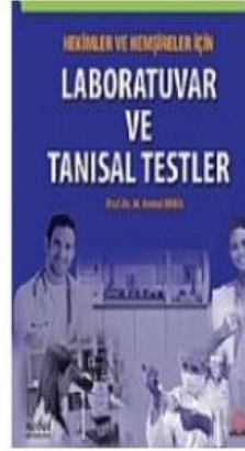
Hekimler Ve Hemşireler İçin Laboratuvar Ve...