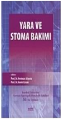
Yara Ve Stoma Bakımı