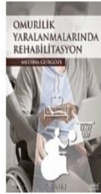
Omurilik Yaralanmalarında Rehabilitasyon