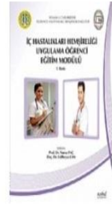
İç Hastalıkları Hemşireliği Uygulama...