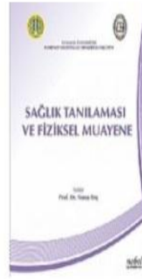
Sağlık Tanılaması Ve Fiziksel Muayene