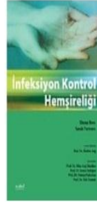
İnfeksiyon Kontrol Hemşireliği