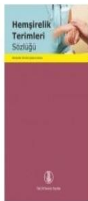
Hemşirelik Terimleri Sözlüğü