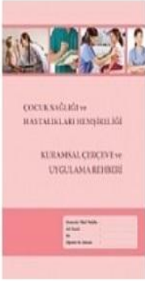
Çocuk Sağlığı Ve Hastalıkları Hemşireliği...