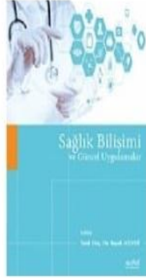
Sağlık Bilişimi Ve Güncel Uygulamalar