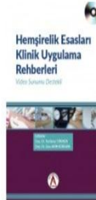
Hemşirelik Esasları Klinik Uygulama...