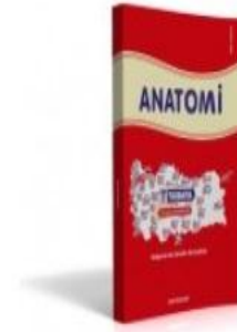
TUS DERS NOTU - ANATOMİ + ŞEKİL ( ERDİNÇ )