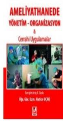
Ameliyathanede Yönetim Organizasyon Ve...