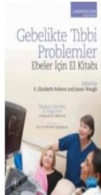
Gebelikte Tıbbi Problemler Ebeler İçin El...