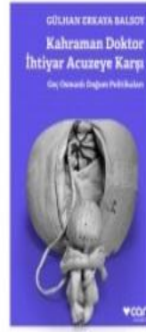
Kahraman Doktor İhtiyar Acuzeye Karşı / ...