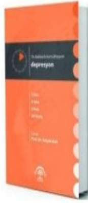
10 Dakikada Konsültasyon: Depresyon