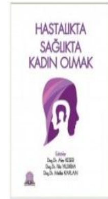
Hastalıkta Sağlıkta Kadın Olmak 2016