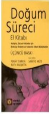
Doğum Süreci El Kitabı